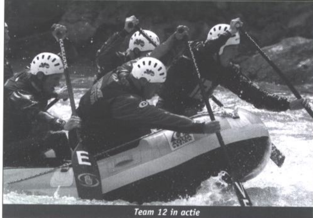
Team 12 in actie

De trainingen werden tijdens het afgelopen Nederlands Kampioenschap beloond met een eerste plaats, het team VET won op alle onderdelen. Voor het kampioenschap, dat in totaal drie dagen duurde, was het team al enkele dagen van tevoren op locatie. "In die tijd konden we een boot pakken en hebben we dat stuk eens goed bevaren. We hebben gekeken wat de beste route was, wat de snelste lijn was en we hebben een paar testtijden neergezet. Toen de wedstrijd begon, konden we alleen nog maar zenuwachtig op de kant staan. We waren van de negentien teams pas als twaalfde aan de beurt."