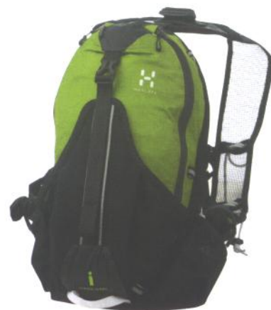
STAMINA Het resultaat van een bezwete samenwerking met de Scandinavische multisport-top. www.haglofs.se

OUTSTANDING OUTDOOR EQUIPMENT. DON'T LEAVE HOME WITHOUT IT.